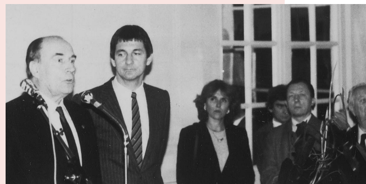
Visite de François Mitterrand en 1981 à COMMERCY