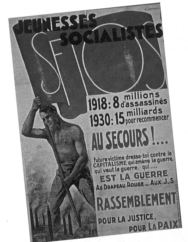
Affiche des Jeunesses socialistes de 1930 pour la paix en Europe